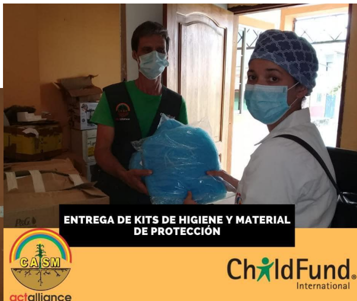
ENTREGA DE KITS DE HIGIENE Y MATERIAL DE PROTECCIÓN