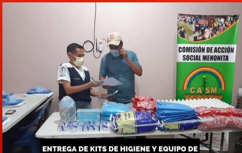
ENTREGA DE KITS DE HIGIENE Y EQUIPO DE BIOSEGURIDAD