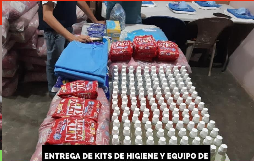
ENTREGA DE KITS DE HIGIENE Y EQUIPO DE BIOSEGURIDAD