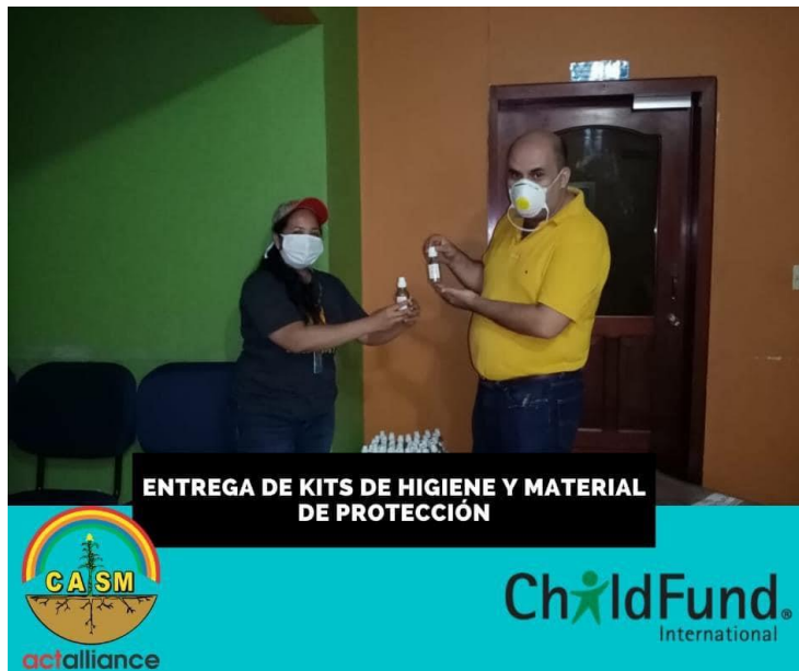
ENTREGA DE KITS DE HIGIENE Y MATERIAL DE PROTECCIÓN