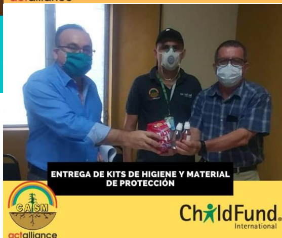
ENTREGA DE KITS DE HIGIENE Y MATERIAL DE PROTECCIÓN

#CASM en asocio con #ChildFund, realizó el día de hoy la entrega de 150 kits de higiene y equipo de bioseguridad, a los SINAGERS de Santa Bárbara, San José de Colinas y Trinidad, con una inversión de L 39,037.50. Mismos que serán utilizados por los equipos que están en primera línea en la prevención, lucha y atención del #COVID19 en el departamento de #SantaBárbara